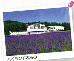
ハイランドふらの