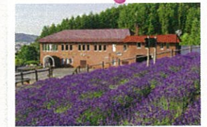
ふらのワイン工場

※状況により、時刻やバス停などが変更になる場合があります。 * Depending on the conditions, the times or bus stop may be changed without prior notice.