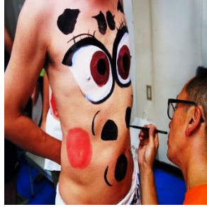
배 그림 그리기