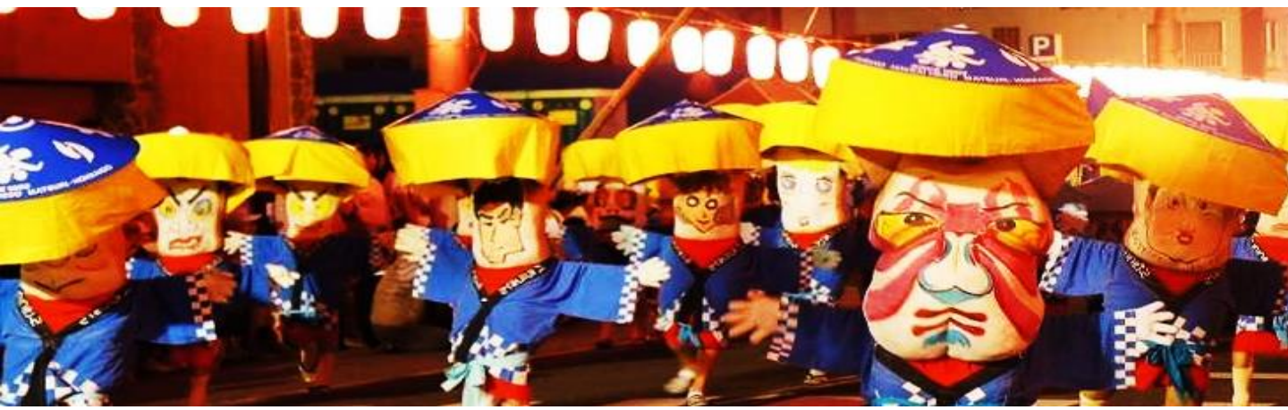
49th 북해 배꼽 축제 “�카이 헤소 마쓰리” BELLYBUTTON FESTIVAL “HOKKAI HESO MATSURI”