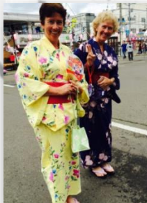
유카타 일본 의상 체험