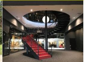
旭川設計中心(意象圖)