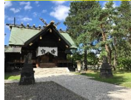
上川神社 頓宮(意象圖)