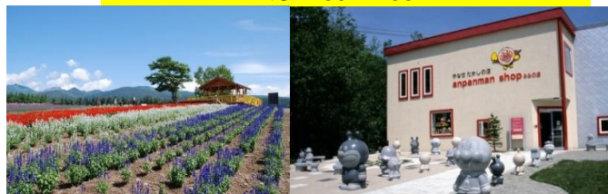
麓鄉展望台(意象圖)

●運行期間/6月9日~17日 六日 6月23日~8月19日 每日 8月25日・26日