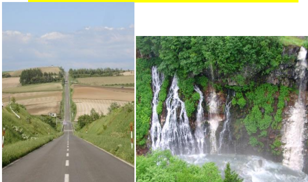
雲霄飛馳之路(意象圖)