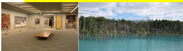
後藤純男美術館(意象圖)

●運行期間/6月9日~17日 六日 6月23日~8月19日 每日 8月25日・26日