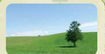
NHK連続テレビ小説「春よ来い」のオープニングで登場した木。