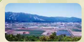
富良野市街地と富良野盆地の田園地帯を一望できる。