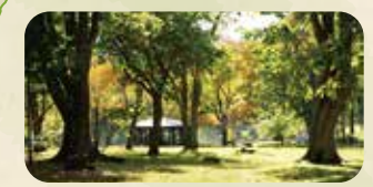
透明度の高い美しい沼が存在し、地元民の憩いの場所として知られている。

※畑の中には入らないようにしましょう。 ※ごみの持ち帰りをお願いします。 ※スピードの出すぎに注意しましょう。 ※野生動物の横断等にお気をつけ下さい。