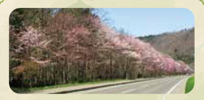
春には富良野塾生が植樹した桜が、秋には紅葉が出迎えてくれるドライブコース。