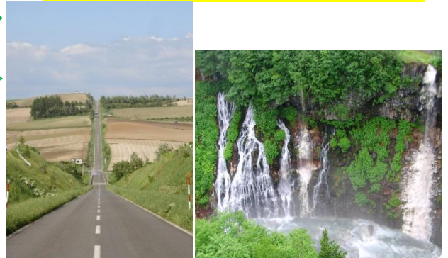
雲霄飛馳之路(意象圖)