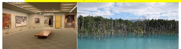
後藤純男美術館(意象圖)

●運行期間/6月9日~17日 六日 6月23日~8月19日 每日 8月25日・26日