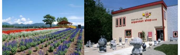
麓鄉展望台(意象圖)

●運行期間/6月9日~17日 六日 6月23日~8月19日 每日 8月25日・26日