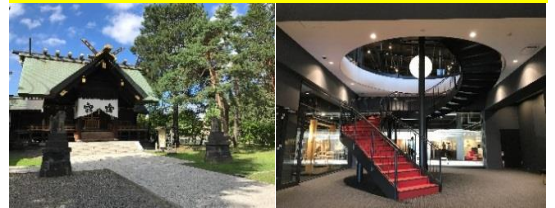
上川神社 頓宮(意象圖)